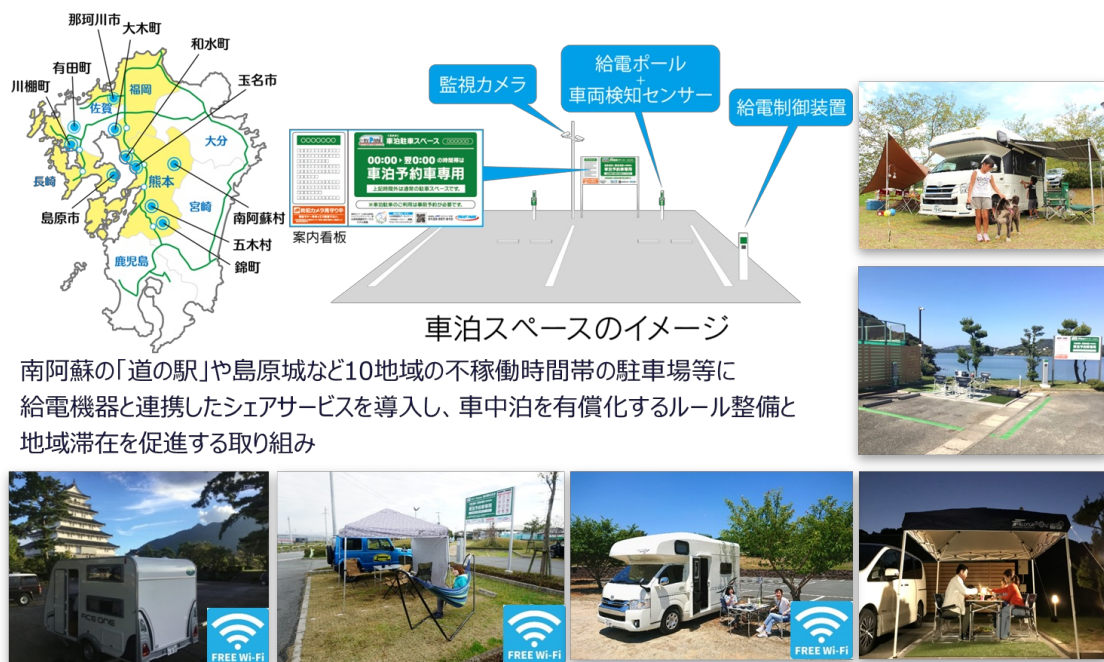
総務省「IoTサービス創出支援事業」シェアリングエコノミー型九州周遊観光サービスモデル事業