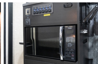
キャンピングカーの車内画像